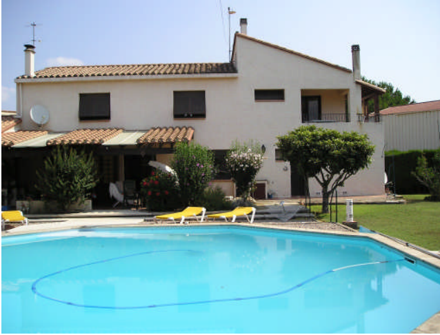
Appartement vu de la piscine ( balcon à l'étage à droite )