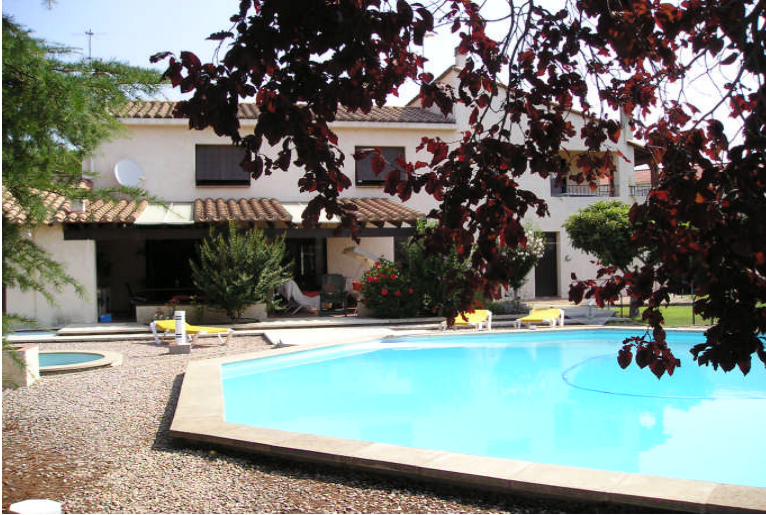
Vue de la piscine