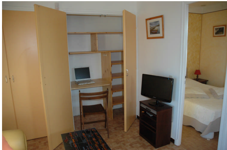
Salon + Espace bureau ( acces Internet WiFi )