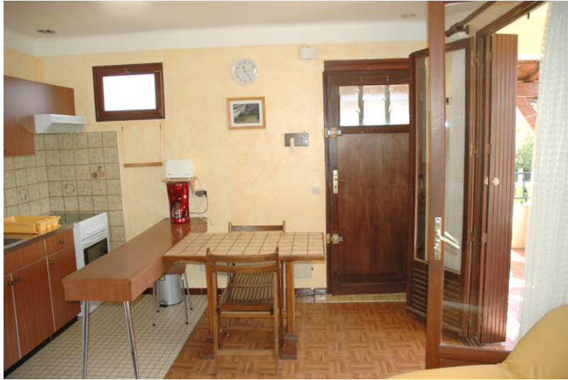
Cuisine Acces terrasse