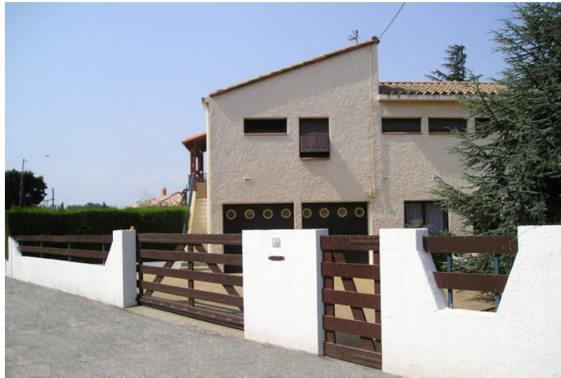
Accès rue du Canigou