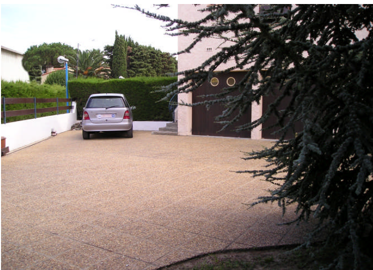
Parking intérieur privatif